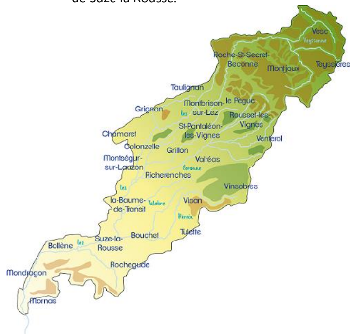
Carte du bassin versant du Lez