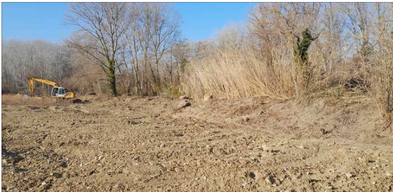
Préparation des sols