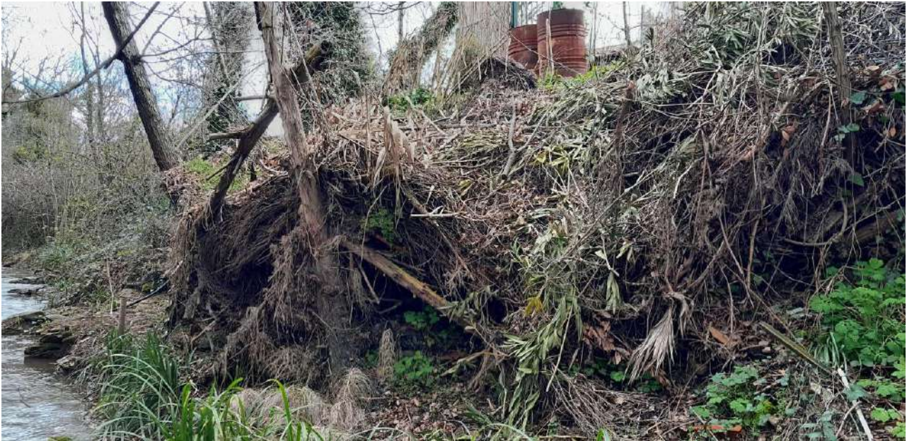
Tas de végétaux en bordure