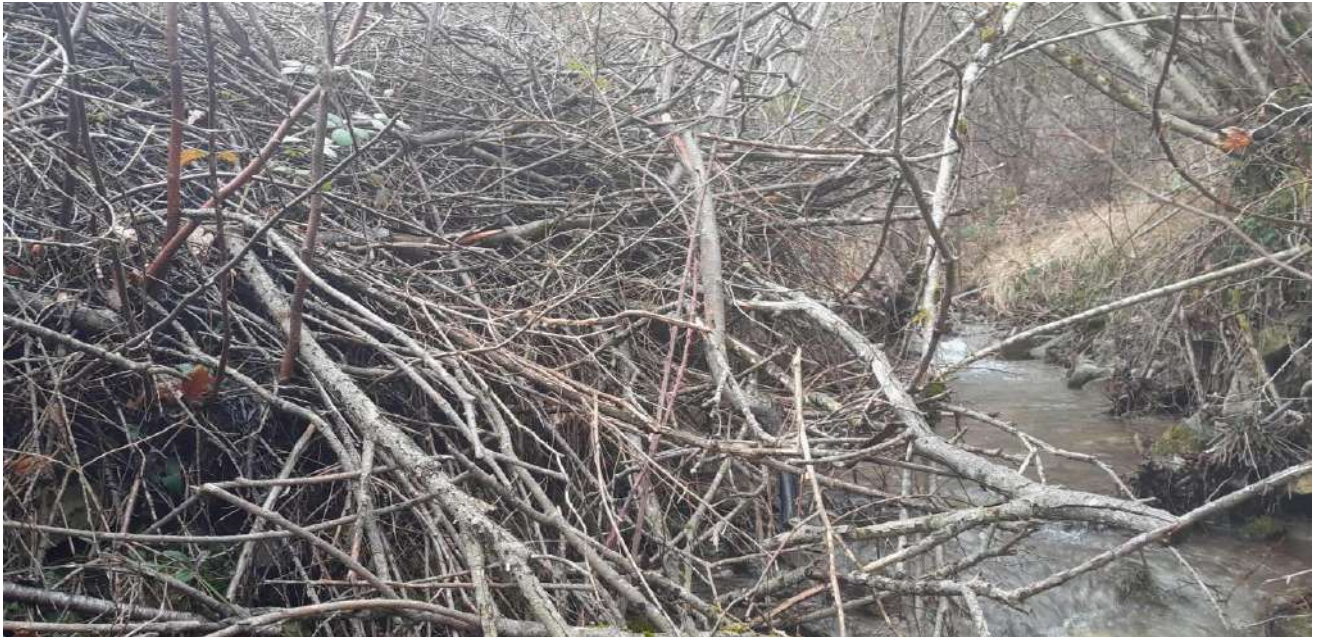
Branches coupées et poussées